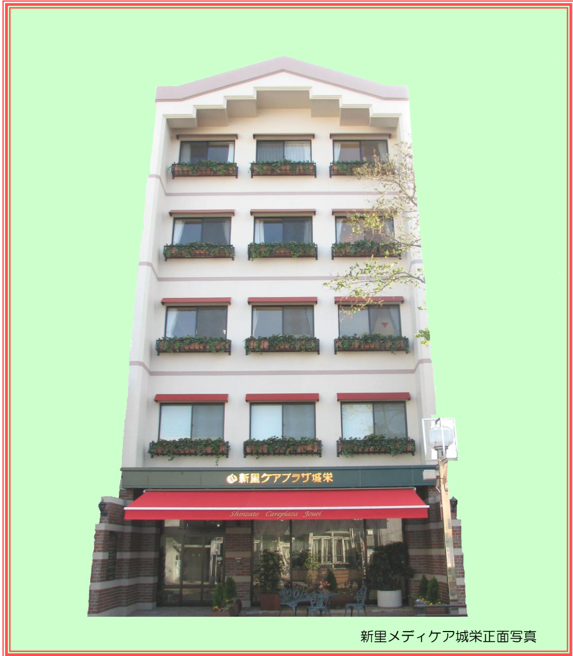
新里メディケア城栄正面写真